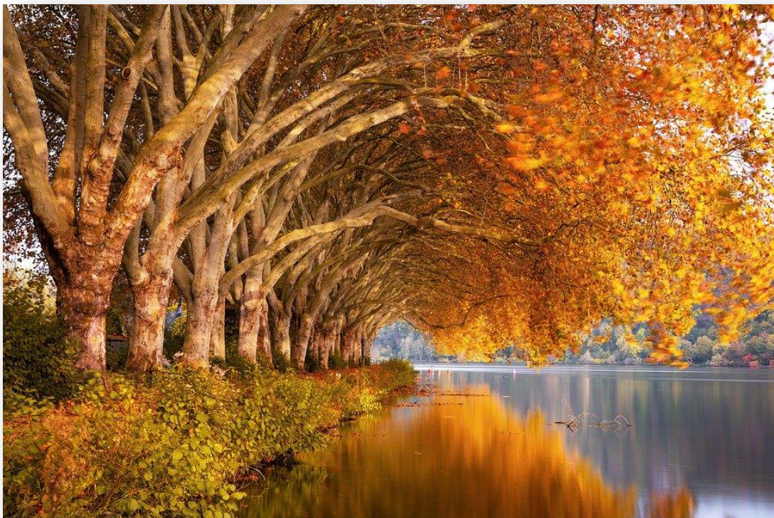
Imagen CCo Creative Commons